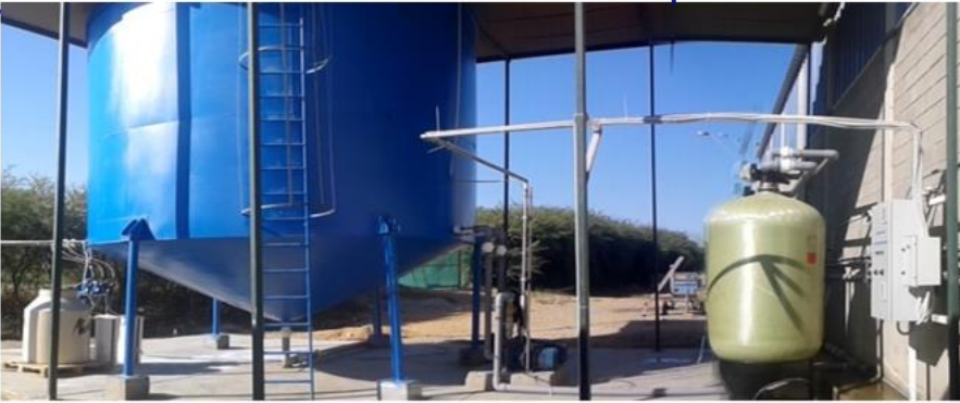
✓ SISTEMA DE POTABILIZACIÓN DE 600M 3 /DIA – HIELO POLAR